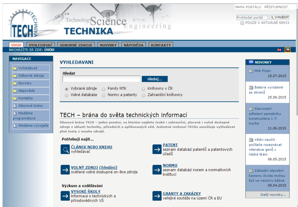
Obrázek 4: Vyhledávací tabulka oborové brány TECH

Oborová brána TECH je dostupná buď z webových stránek Národní technické knihovny, nebo následujícím odkazem http://tech.jib.cz/oborova-brana-technika-tech-uvod?set_language=cs