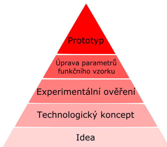
Obrázek 1: Zjednodušené schéma TRL

Projektová dokumentace, tedy dostupné písemné i elektronické dokumenty k projektu (dále PD), musí prokázat jednotlivé vývojové fáze, což je vhodné ověřit pomocí odpovědí na následující otázky.